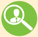
Бүртгэлтэй ажилгүй иргэдийн тоо