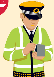
Бүртгэгдсэн гэмт хэрэг