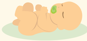
Төрсөн хүүхдийн тоо