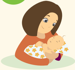
Амаржсан эхийн тоо