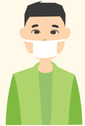
Халдварт өвчнөөр өвчилсөн хүний тоо